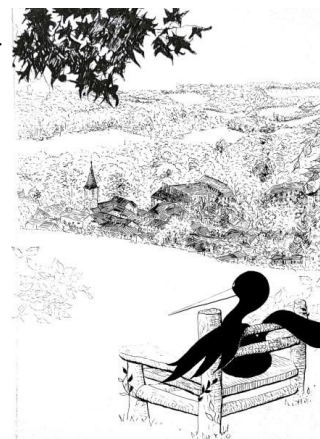
Illustration Léne Moréin

À la clé : un chèque de 1500€, une prime « coup de cœur » de 1000€ du Conseil Départemental et une campagne de communication offerte.